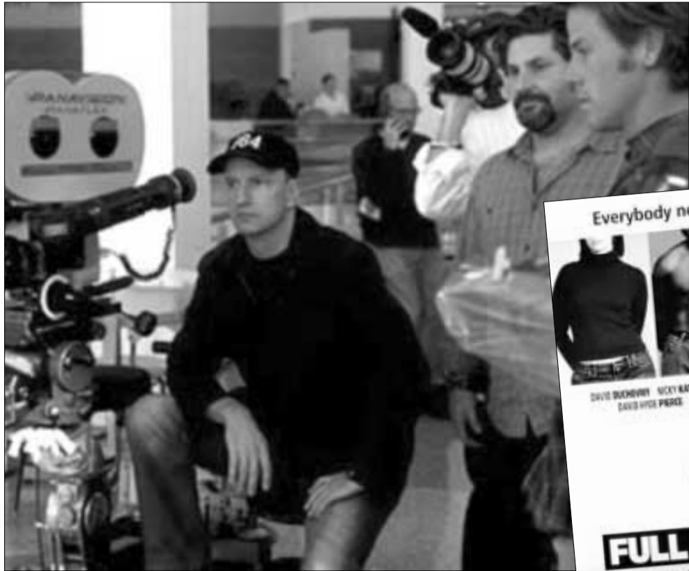
المخرج ستيفن سودربيرغ أثناء تصوير الفيلم

توتز. وهذا أحد أفضل النواحي التي حققها سودربيرغ في هذا الفيلم: انه فيلم يتطور بشكل متواصل. فما ان تفكر انك اكتشفت هوية الشخصيات وعلاقتها ببعضها، يتكشف لك شيء جديد. والحوار، ومعظمه غويي «تلقائي» ينساب انسياباً طبيعياً. «فول فرونتال» من توزيع ميراماكس ويستغرق عرضه 100 دقيقة ودقيقة.